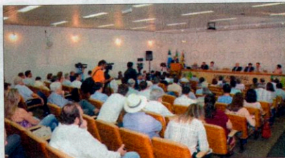
Encontro de Tecnologias já se tornou tradicional no Sindicato Rural

O investimento para estudantes é de R$ 50,00,