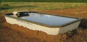
» BEBEDOUROS E RESERVATÓRIOS