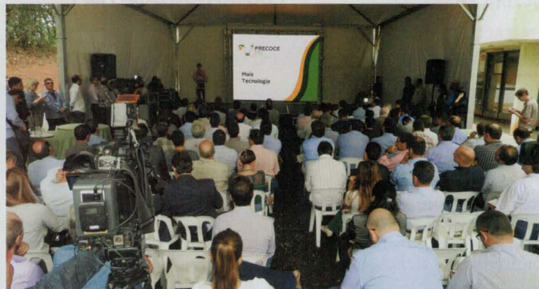
Cerimônia de ativação oficial do programa Precoce MS, realizada na reserva Ecológica do Parque dos Poderes, em Campo Grande, MS.

O foco do novo programa, lançado em 17 de abril, é cancelar a carne do Mato Grosso do Sul como a melhor do Brasil