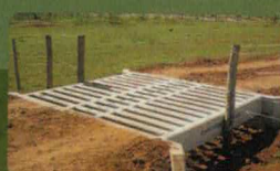
» MATA BURROS