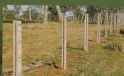
» POSTES DE CERCA PROTENDIDO