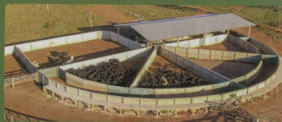
» CURRAIS ANTIESTRESSÉ