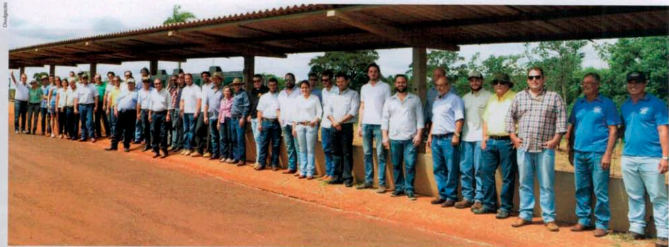
6ª edição do PADS Senepol celebra novos campeões machos e fêmeas.