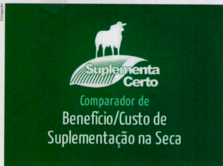
Interface do aplicativo Suplementa Certo.

Auxilia na tomada de decisão do produtor e na avaliação do benefício/custo da suplementação no período da seca.