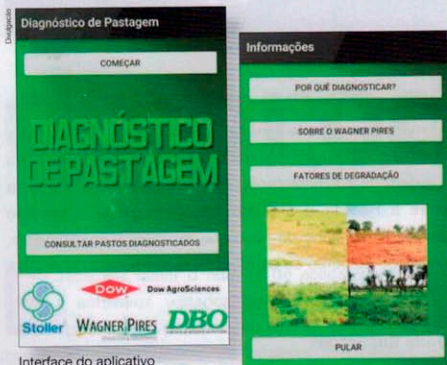
Interface do aplicativo Diagnóstico de Pastagem.

versão para Android disponível no Google Play.