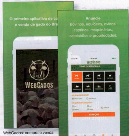
WebGados: compra e venda de animais, propriedades, produtos e insumos agrícolas.

Google Play/APP Store/www.webgados.com.br