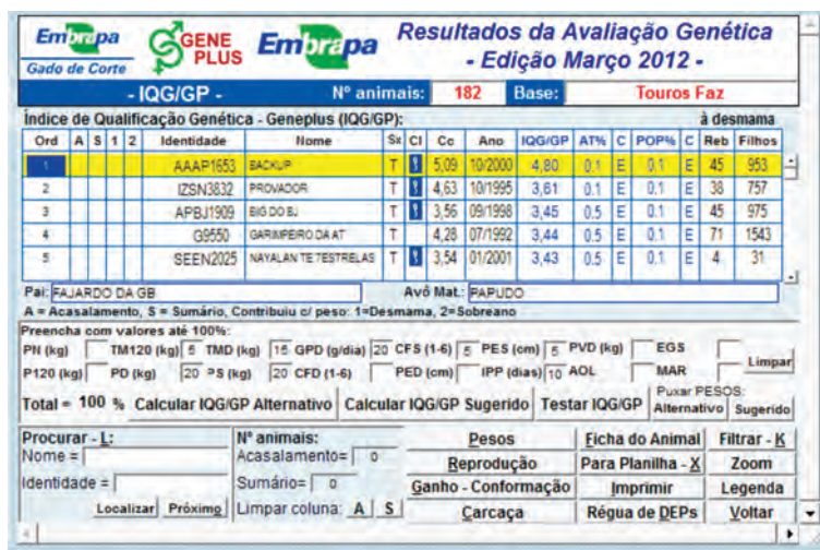
FIGURA 14.6. Uso da opção para cálculo do IQG/GP.