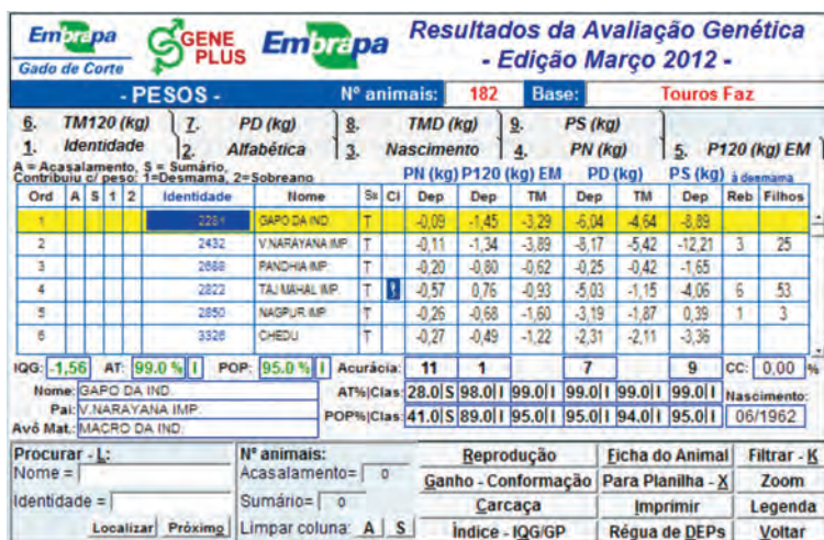
FIGURA 14.4. Resultados da avaliação genética para a opção Touros Usados Na Fazenda .