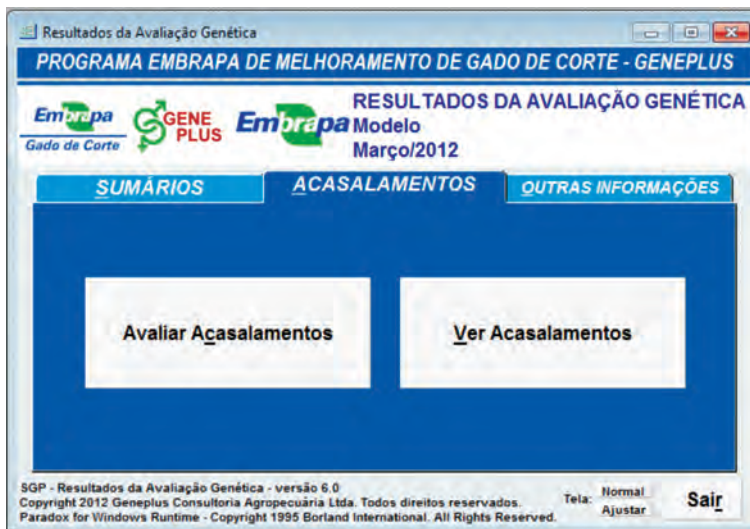
FIGURA 14.2. Tela do software no ambiente ACASALAMENTOS .

No ambiente OUTRAS INFORMAÇÕES (Figura 14.3) são apresentadas sete opções. Na primeira são apresentadas as Tendências Genéticas & Médias Gerais , permitindo visualizar os gráficos das tendências genéticas da fazenda e do programa como um todo, bem como as médias fenotípicas e das DEPs das características do programa. Na segunda constam as Médias das DEPs por Ano , onde são encontradas para cada uma das características as médias das DEPs relativas à fazenda e ao programa, por ano. Outra opção é referente aos Touros usados x Ano , na qual estão relacionados os touros (RGD, nome, IQG e percentil) e o número de filhos no programa, por ano em que foram utilizados.