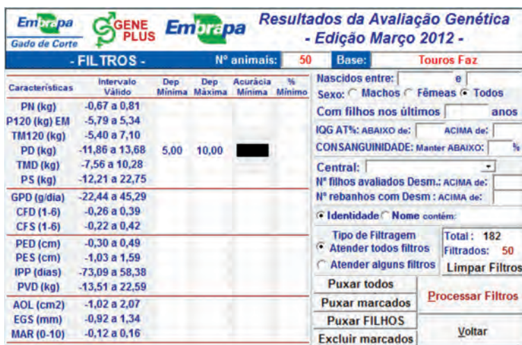
FIGURA 14.5. Tela com a apresentação da opção Filtro .