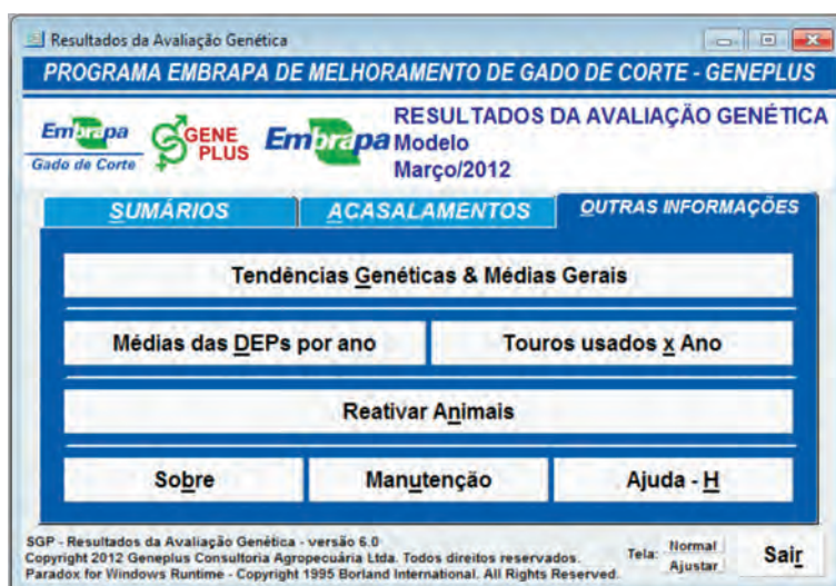
FIGURA 14.3. Tela do software no ambiente OUTRAS INFORMAÇÕES .

Uma quarta opção é a de Reativar Animais , a qual permite a recuperação de algum animal desativado dos sumários. As demais opções: Sobre , Manutenção e Ajuda são, respectivamente, informativa, reparo no software e de instruções para utilização do aplicativo.