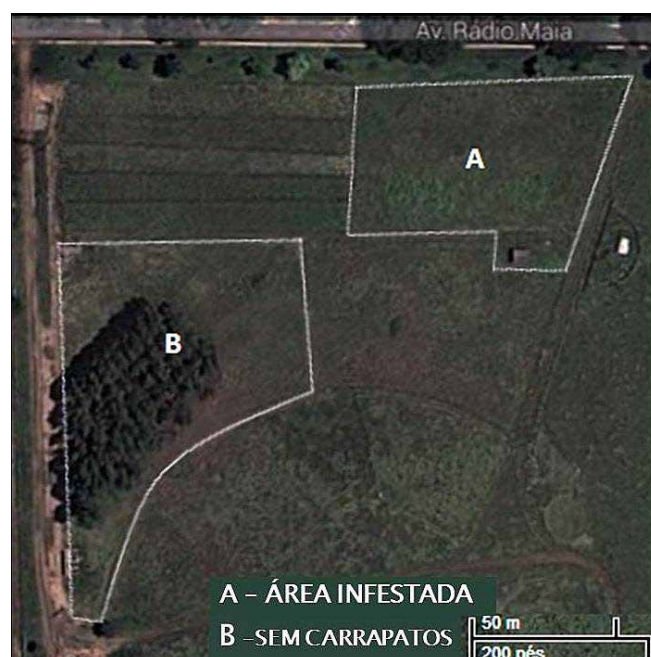
Figura 1. Vista aérea dos piquetes utilizados para avaliar a capacidade de ovinos deslanados em manter populações do parasita na ausência de bovinos. Imagem colhida do Google Map. A – Área infestada por carrapatos; B – Área livre de carrapatos.

Como área de estudo utilizou-se dois piquetes, um deles (A) com área de 0,5 ha e pastagem de Panicum maximum cv. Massai e Brachiaria decumbens e outro (B) com área de 0,72 ha contendo apenas Brachiaria decumbens (Fig. 1). Conforme pode ser visualizado na Figura 1 o piquete A distava 18 m do piquete B. No piquete A, infestado previamente com o carrapato R. microplus por bovinos por um período de quatro dias (21 de fevereiro a 24 de fevereiro de 2013), foram colocadas nove ovelhas prenhes deslanadas. Passados 41 dias foi observado que as ovelhas estavam naturalmente infestadas por carrapatos.