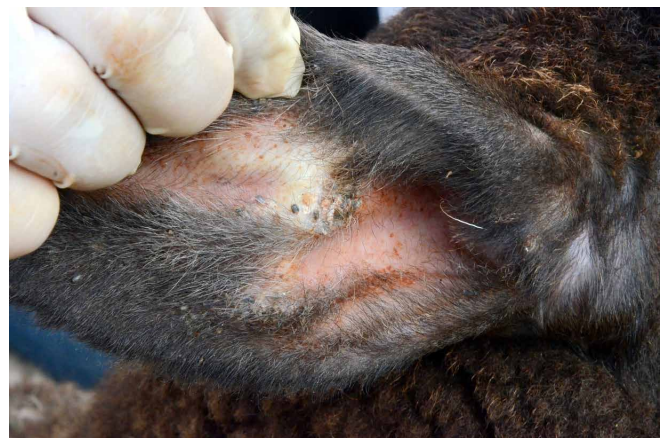
Figura 4. Orelha de ovino deslanado apresentando carrapatos ( Rhipicephalus microplus ) em fase de ingurgitamento.

Uma vez detectadas larvas nas pastagens do piquete A, as ovelhas eram para ali trazidas do piquete B. A partir de então eram examinadas diariamente para registrar a presença de larvas fixadas; acompanhar o desenvolvimento das mesmas (Fig. 4) e registrar a data de desprendimento das teleóginas (carrapatos adultos alimentados, ingurgitados, ou popularmente conhecidos como “mamonas”). O número de carrapatos desprendidos foi determinado com base no número de indivíduos restantes em fase final de alimentação. O período parasitário compreendeu o tempo entre a detecção das primeiras larvas sobre as ovelhas até o desprendimento de todas as teleóginas.