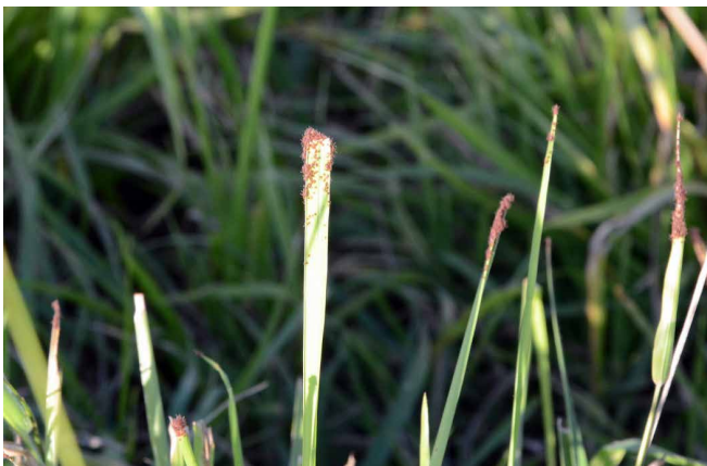
Figura 3. Incidência de larvas do carrapato Rhipicephalus microplus na pastagem infestada (Piquete A).

No piquete A, semanalmente, em todo o período de estudo a pastagem foi monitorada visualmente por três pessoas, durante duas horas em cada oportunidade, para observar a presença de larvas na pastagem (Fig. 3). Foram constatados intervalos variáveis, conforme a época do ano, de ausência absoluta de larvas de carrapatos nas pastagens. Para evitar que acontecessem sobreposições de gerações, as ovelhas eram removidas para o piquete B ao final da fase parasitária de cada geração. Com base nas observações e procedimento acima se admitiu não ter ocorrido sobreposição de gerações.