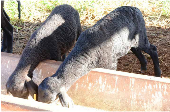
Figura 2. Imagem de cordeiros deslanados que participaram nas avaliações sobre a capacidade de manter populações do carrapato Rhipicephalus microplus na ausência de bovinos.

A partir de então a população de carrapatos passou a ser monitorada diariamente nas ovelhas e semanalmente na pastagem, conforme será detalhado logo abaixo. No mês de abril o número de ovinos em observação aumentou para 14 com o nascimento de cinco cordeiros (Fig. 2).